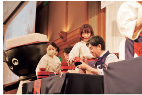
盛岡市長 内舘茂氏